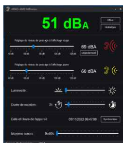
Interface logiciel PC