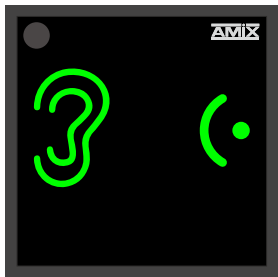
Le niveau sonore est de faible à moyen