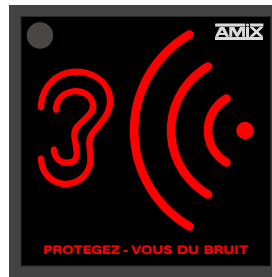
Le niveau sonore est trop fort