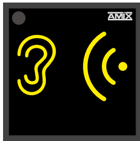
Le niveau sonore est de moyen à fort