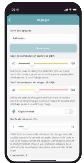
Réglages via smartphone

Historique : Permet le téléchargement de l'historique en LAeq 1 min sur les 480 dernières heures.